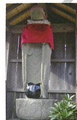
7 石灯笼・地藏 眠り地藏・歌碑・追分の道標