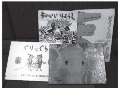
『まのいいりょうし』 瀬田 貞二／再話 赤羽 末吉／画 『ぞうくんのさんぽ』 なかの ひろたか／さく・え 『ぐるんぱのようちえん』 西内 みなみ／さく 堀内 誠一／え 『ぐりとぐら』 なかがわ りえこ／さく おおむら ゆりこ／え 福音館書店

むかし、子どもたちに読んだあのなつかしい絵本たち。 子どもの頃にわくわくしながら、読んでもらった絵本たち。 世代を越えて永く愛されつづけている“こどものとも”。 知っている絵本も、初めて見る絵本も、 ぜひ手にとってみてください。