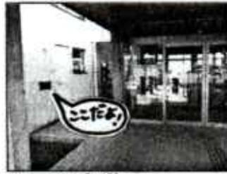
↑ 入り口左側にある ブックポスト