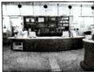
↑ 図書館入ってすぐにある カウンター。