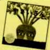
『やさいさん』 t upera tupera さく