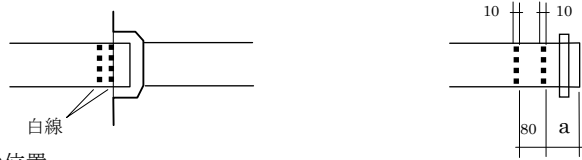
挿し口白線の位置

4) 接合にあたっては、バックアップリング方向を確認し、白線の受け口端面の位置に合うように挿し口を挿入すること。