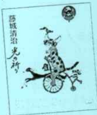
藤城清治作品集『光の祈り』 藤城清治・著 白泉社