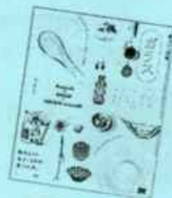
暮らしの図鑑『ガラス』 みつまともこ・著 翔泳社