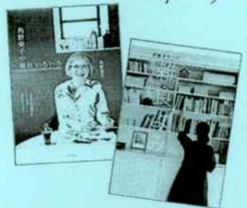
『角野栄子の毎日いろいろ』角野栄子・著 KADOKAWA