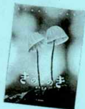
『きのこのき』 きになるきのこのきほんのほん 新井 文彦・著 文一総合出版 (474.8)

夏山が青翠でみずみずしい季節。 梅雨の合間に、里山の散策はいか がでしょう。 自然と対峙することでしか味わえな い出会いがあるかもしれません。