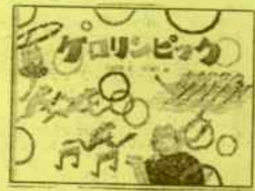
『ケロリンピック』(エケ) 笑景悦子文 古川裕子絵

カエルのせかいにもオリンピックがあるの!? カエルたちがいろいろなきょうぎにちょうせんするよ!