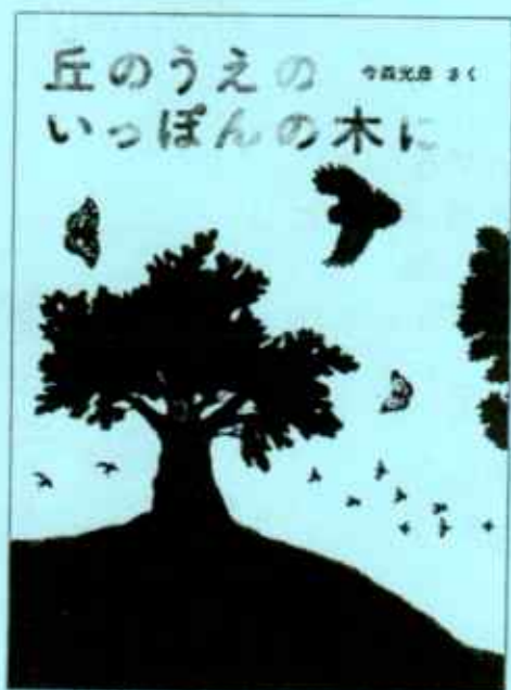
『丘のうえのいっほんの木に』 今森光彦 童心社 (E)