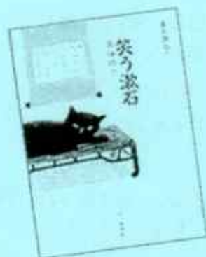
『笑う歌石』 正岡 子規・著 七つの森書館