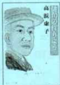
『俳句の作りよう』 高浜 虚子・著 角川学芸出版

どう始めればいいのか 判らぬ人は、 「何でもいっから 十七字を並べて ごらんなさい。」 ということですよ！ まずは一読を！！