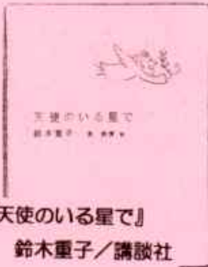
『天使のいる星で』 鈴木重子/講談社