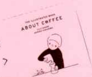
庄野雄治 『コーヒーの絵本』 ミルブックス