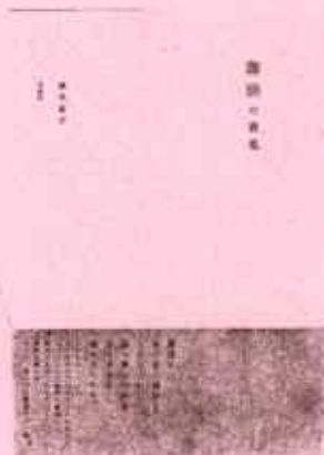
蕪木祐介 『珈琲の表現』 雷鳥社