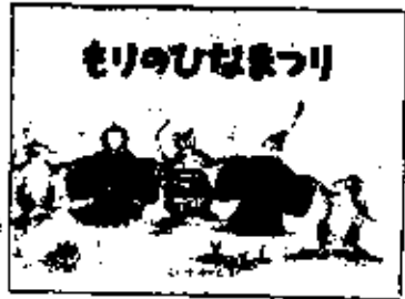
もりの ひなまつり こいびわりん