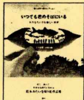
『いつでも君のそばにいる』 リト@葉っぱ切り絵/ぶん 講談社 (726.9リ)