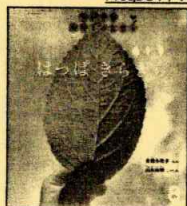
『はっぱきらきら』(雑誌) 多田多恵子/ぶん 福音館書店

緑が鮮やかな季節になってまいりました。 気持ちのいい気候の中、のんびり読書は いかがでしょうか？