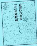
『夏井いつきの「花」の歳時記』夏井いつき著 世界文化社(911.3) 『春はあけぼの』清少納言文 斎藤孝編 ほんぷ出版(E)