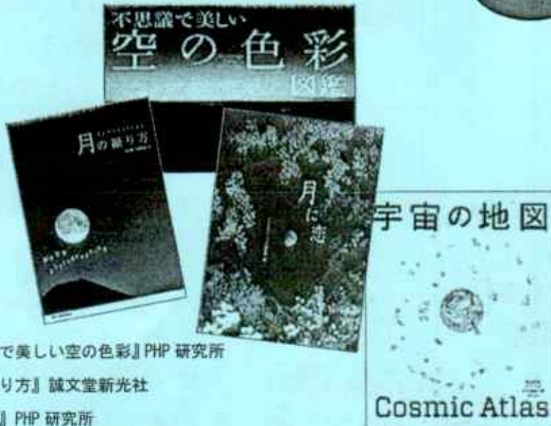
『ふしぎで美しい空の色彩』PHP 研究所