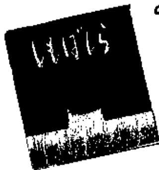
しもはし 野坂参将/作 (E3)

す、く、さ、く、す、く、さ、く。 しもはしを踏むと、楽 しい音が聞こえるよ。 図書館の前の、ささ山に も、大きな、しもはし発見!!