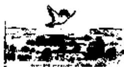
こすずめのぼうけん

カフェの前は、カントリー キッチンさんのパンがばら びます! ぜひ、おうちの人 ときてね☆